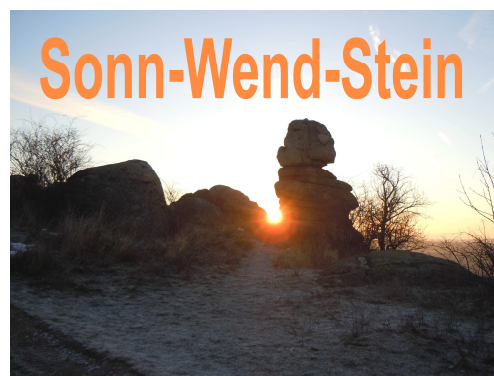
Bild: Wächter/Kogelsteine nördlich von Grafenberg bei Eggenburg