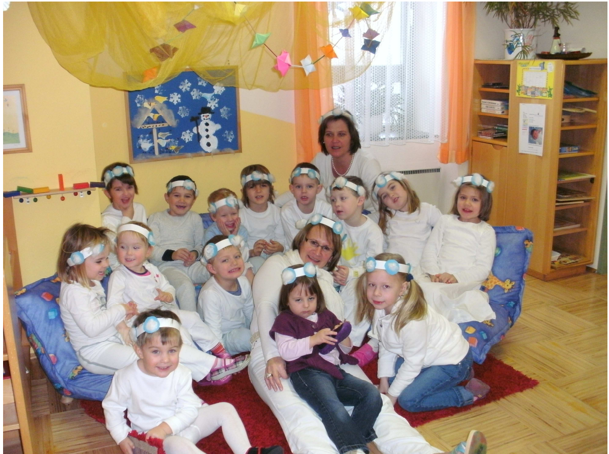
(Bild: Schneeflockenfest im Kindergarten Mittergrabern – siehe Artikel Seite 2)